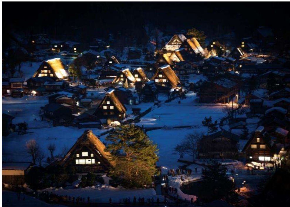
DECEMBRE 2022 – 合掌造り, GASSHO-ZUKURI, UNESCO WORLD HERITAGE, GIFU AREA