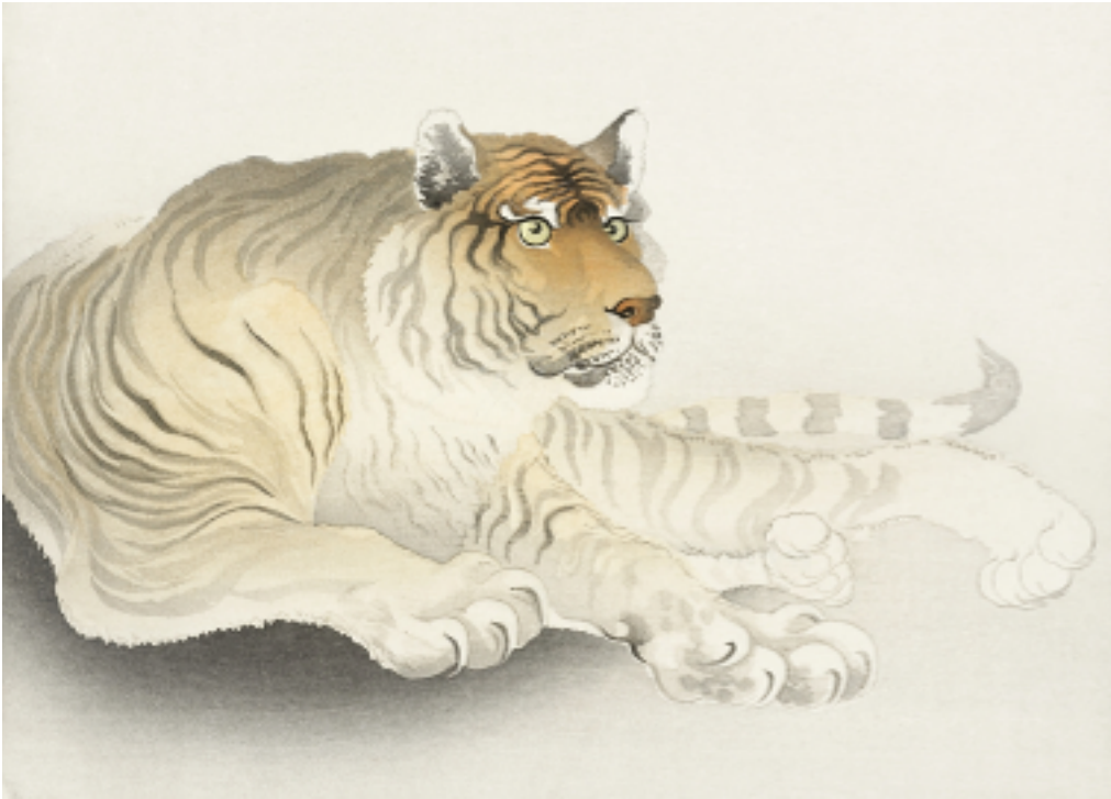
FEVRIER 2024 - 虎, LE TIGRE, SYMBOLE DE PUISSANCE - OHARA KOSON