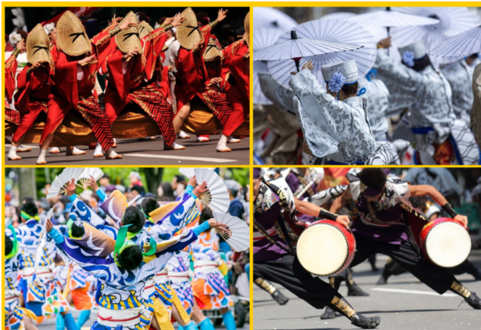
TRADITIONAL YOSAKOI SORAN DANCE FESTIVAL WITH MASSIVE COMPETITION, HOLDING PLACE EARLY JUNE IN SAPPORO